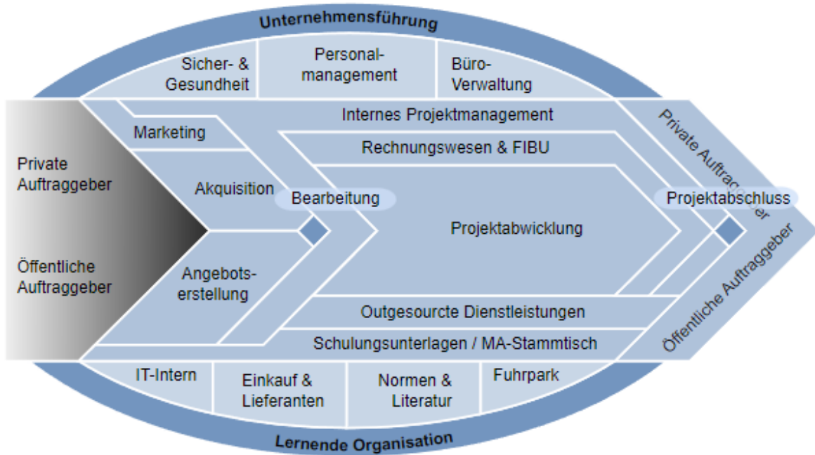
Abb. 1: Prozessbild „SPP-Prozesse“ erste Ebene zur Navigation

Der standortübergreifende Zugriff auf alle Prozesse wird durch ein exzellentes, speziell für und von SPP entwickeltes IT-Tool, ermöglicht. Einfache, selbsterklärende Bedienung, kompakter Online-Zugriff auf jahrelanges Projektwissen und das Engagement aller Verantwortlichen, die für die laufende Aktualisierung und Verbesserung sorgen – all das unterstützt unsere Mitarbeiter punktgenau in ihrer Projektabwicklung