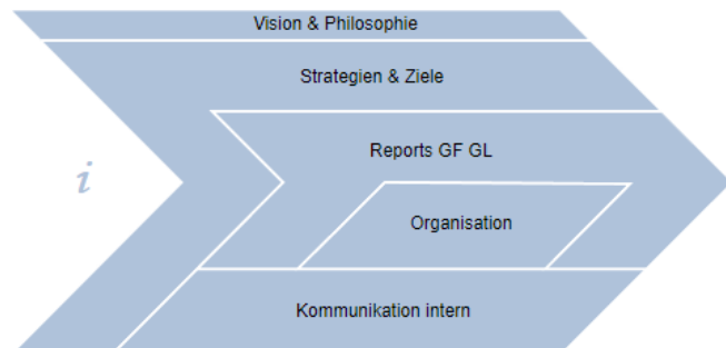
Abb.2: Prozessbild Übersicht „Unternehmensführung“

Somit wird der Fokus auf das Erreichen der gemeinsamen Unternehmensziele gelegt.